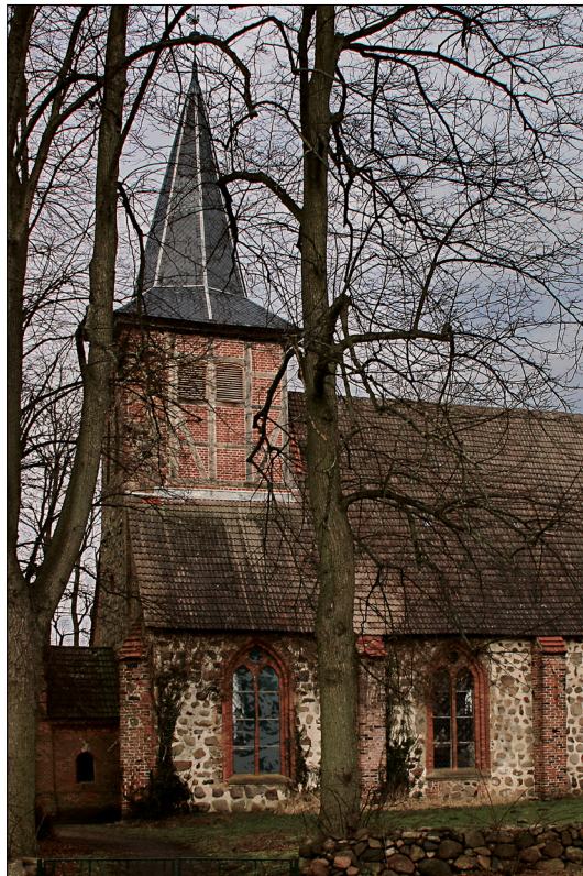
Gestaltung der beiden Turmfenster Kirche Warsow